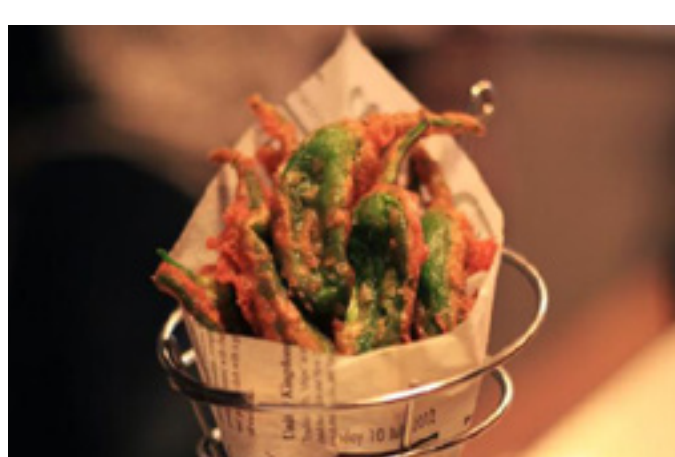
Pimientos del padrón rebozados en tempura 7,5€