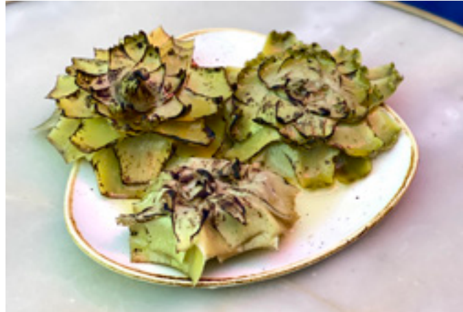
Corazón de alcachofa flambeado 10€