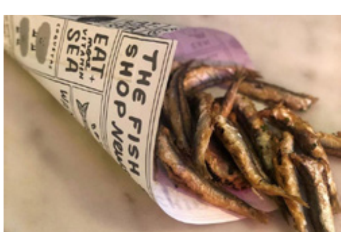
Boquerones fritos 6€