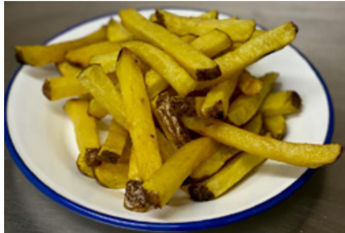
Patatas fritas 4€