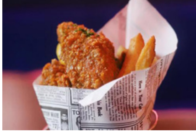
Fish and chips 9€ S 7€ / L 13,5€