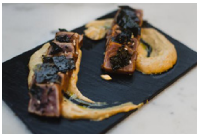
Tapaki de atún 12,5€