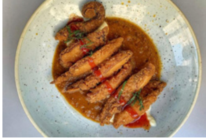
Bravas de pulpo rebozadas con panco 9,9€