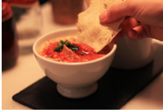
Hummus con papadam frito 4,9€