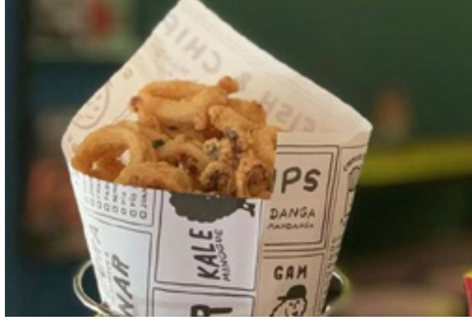
Calamari and chips 9€