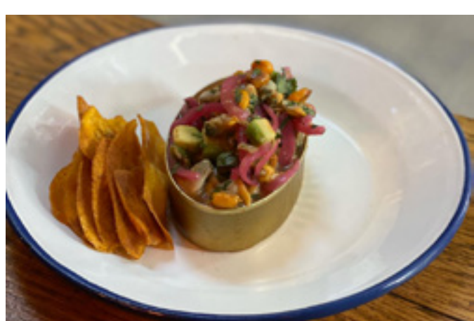
Ceviche de berberechos 8,5€