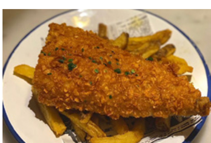
Bacalao and chips 8,5€