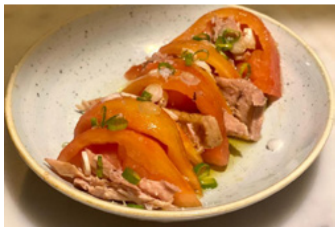
Ensalada de tomate y atún 7,5€