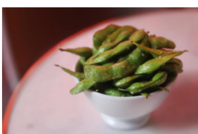
Edamame trufado 4,5€