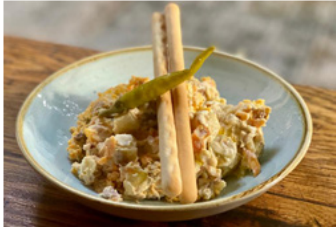
Ensaladilla rusa 7€