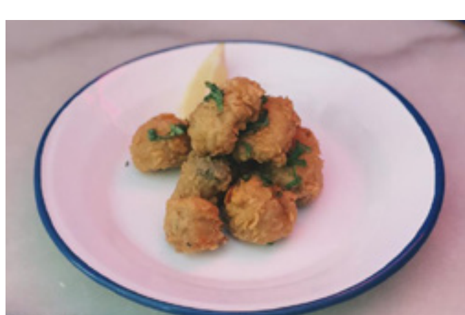
Cazón en adobo 6,5€